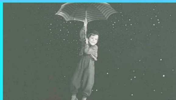
ΠΡΟΓΡΑΜΜΑ ΤΑΙΝΙΩΝ ΜΙΚΡΟΥ ΜΗΚΟΥΣ The Red Balloon, Jemima & Johnny, Palle Alone In The World

Τάξεις: Α΄-Ε΄ Δημοτικού Ηλικίες: 6-10 ετών